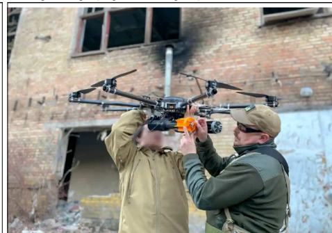
우크라이나 드론 부대 Aerorozvidka

('21.8월 우크라이나 키이우, 독립일 기념 퍼레이드)