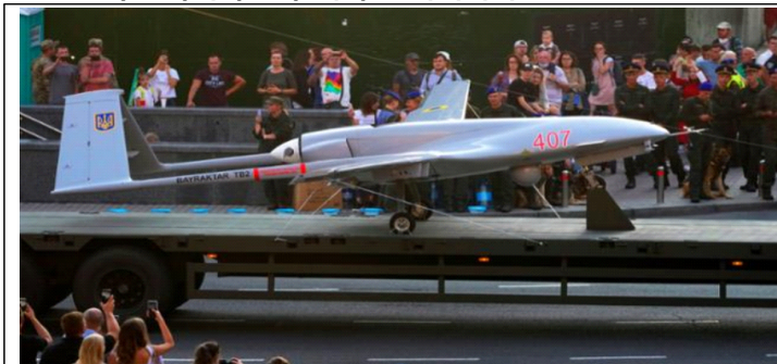
우크라이나군의 터키산 바이락타르 TB-2 드론

('21.8월 우크라이나 키이우, 독립일 기념 퍼레이드)